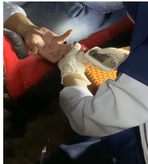
Gambar 4. Pemeriksaan hemoglobin metode Point Of Care Testing (POCT).