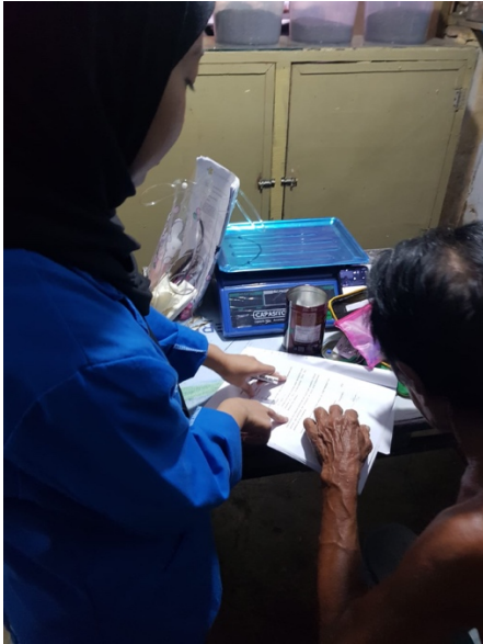
Gambar 1. Pengisian lembar informed consent (Lembar persetujuan).