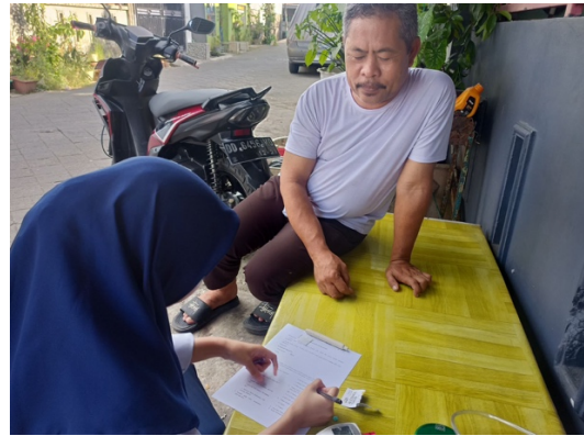
Gambar 2. Pengisian lembar kuesioner