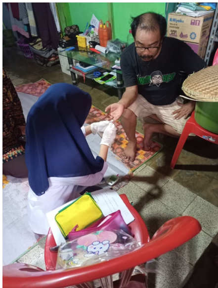
Gambar 3. Pengambilan sampel darah kapiler pada jari manis.